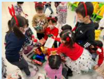
我哋嘅禮物同隔離一樣高啦！