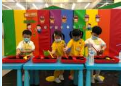
移植花苗前要先放泥土！