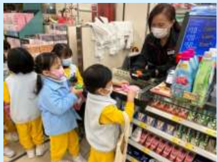
姨姨，請問幾多錢啊？