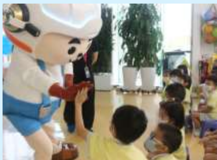
我承諾會注意安全！