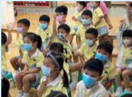
機電安全，我會注意！