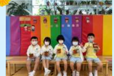
種植花朵真係好開心呀！