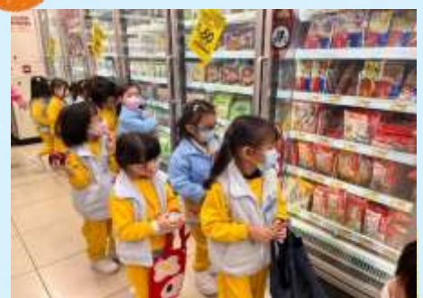
雪櫃入面放咗好多冷藏食物！