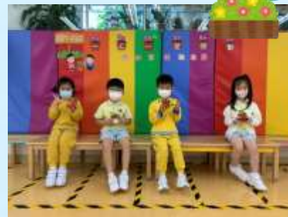
呢棵三色堇系我哋種㗎！