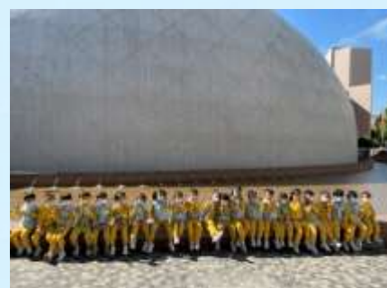
參觀太空館真有趣！