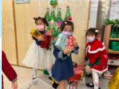
一齊拎走聖誕禮物先！