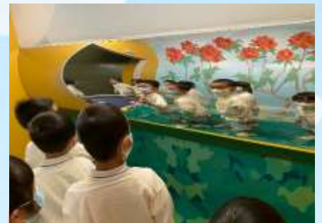
我哋係鏡子入面變得唔同嘞！