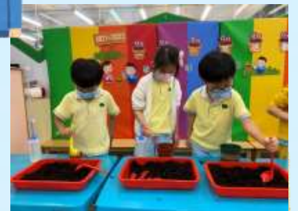
放咁多泥土夠唔夠呢？