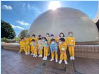
太空館的外型真神奇！