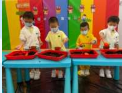
好期待花兒會盛開啊！