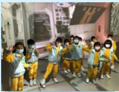
你有無試過太空漫步啊？