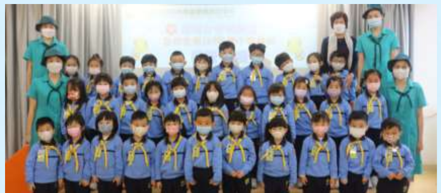
快樂小蜜蜂宣誓禮圓滿結束啦！