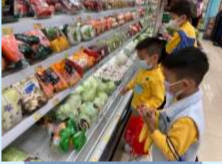
今日啲菜好新鮮啊！