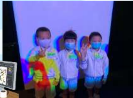
身上有唔同嘅光同影子啊！