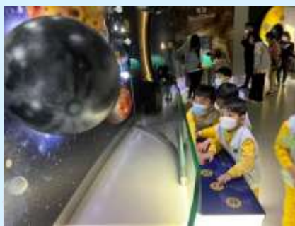
嘩！你睇吓！幾大個星球！