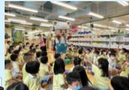
大家都要注意機電安全！