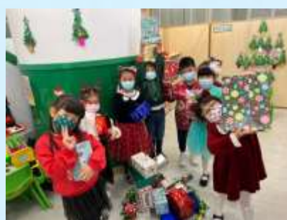
我哋一齊堆禮物啊！