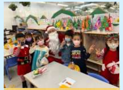
聖誕老人派禮物畀我哋啊！