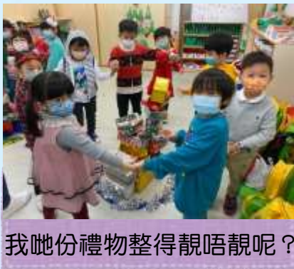
我哋份禮物整得靚唔靚呢？