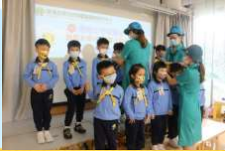
戴咗領帶之後我哋就係小蜜蜂啦！