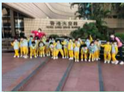
我哋下次都想再參觀啊！