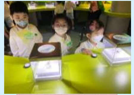
昆蟲嘅身體真神奇！