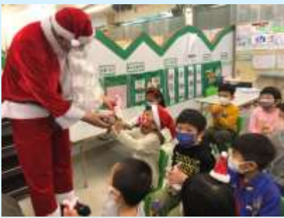
唔知聖誕老人準備咗咩禮物呢？