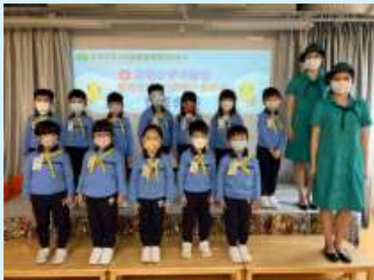
相信我哋會做得更好！