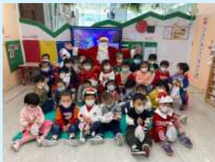
聖誕老人同我哋影相啊！