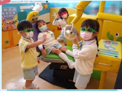
我哋檢查緊牙齒啊！