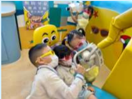
你估吓我哋睇緊咩？