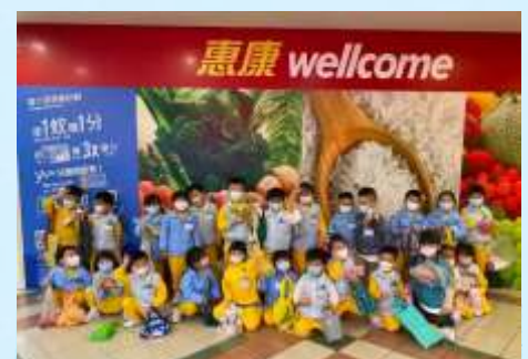
我係超級市場買咗好多嘢啊！