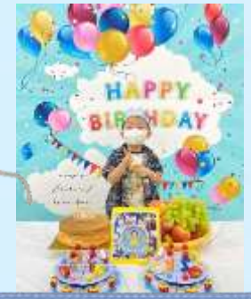
好鐘意開生日會啊！