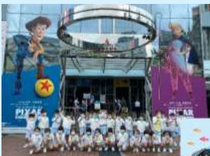
參觀科學館真開心！