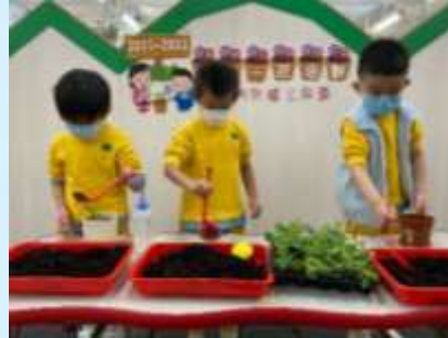
我哋系種植小專家！