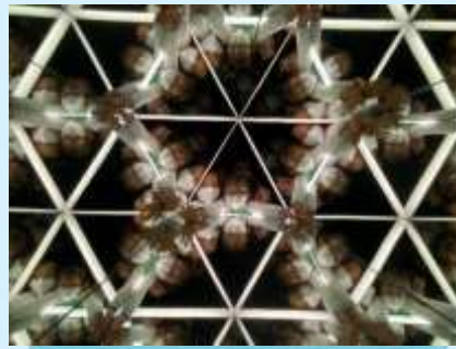
神奇萬花筒！變變變！