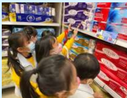
原來超市有紙巾賣㗎！