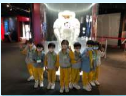
我都想着呢件衫上太空！