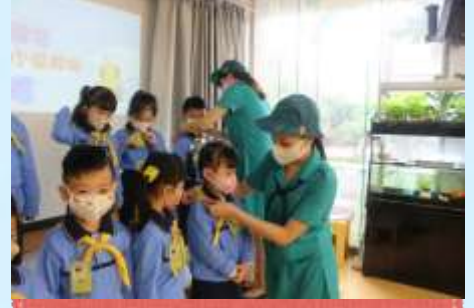
我有快樂小蜜蜂嘅領帶啦！