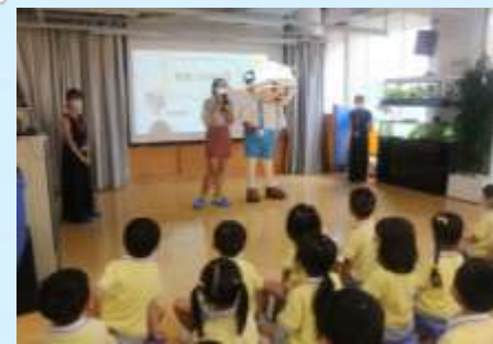
多謝機電安全大使！