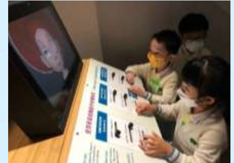
原來動畫系咁樣整㗎！