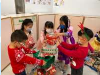
小心啲啊！慢慢疊高佢！