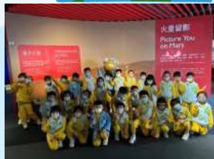
去到火星要留影先！