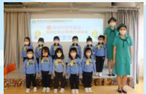
我願意成為快樂小蜜蜂！