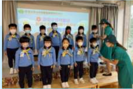
恭喜你成為快樂小蜜蜂的一員！