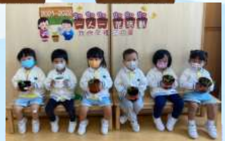
你睇！我哋盆花靚唔靚啊？