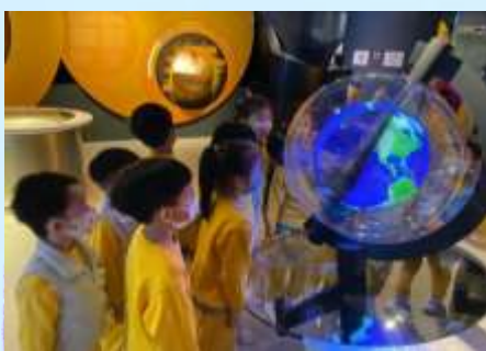
原來我哋住緊嘅地球係咁㗎！