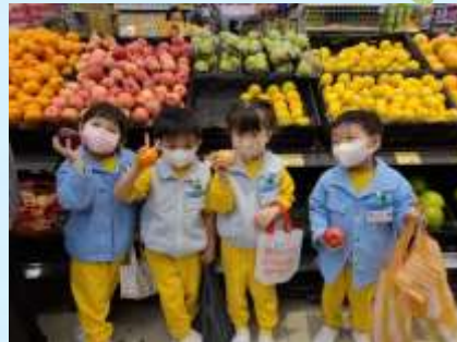
呢度有好新鮮嘅水果！