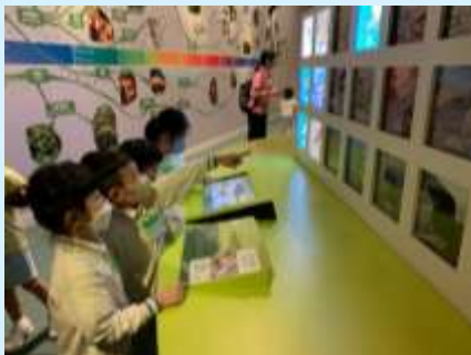
你估吓我哋睇緊咩？