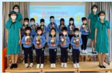
我哋會用心照顧小盆栽！