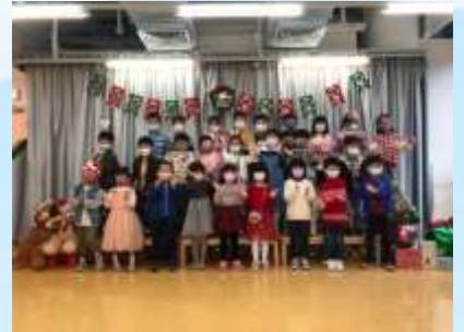
一起來表演聖誕歌！