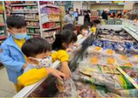
我BBQ嗰時都見過呢啲食物！