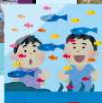
啲海洋生物好靚啊！