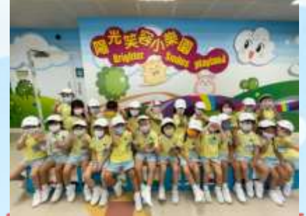
日日刷牙先會有陽光笑容！