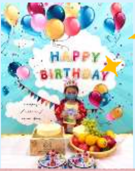
開生日會真系好開心啊！