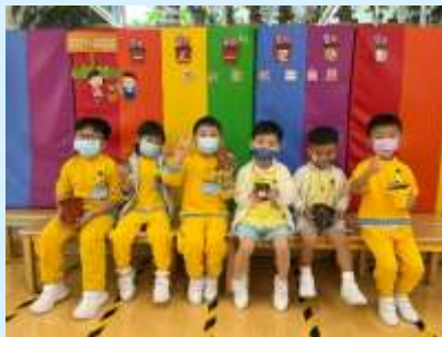
我有帶佢返去曬太陽！