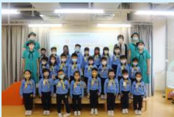
一齊影張大合照先！