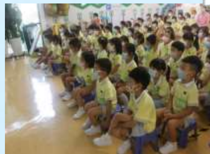
留心聽吓有咩要注意先！