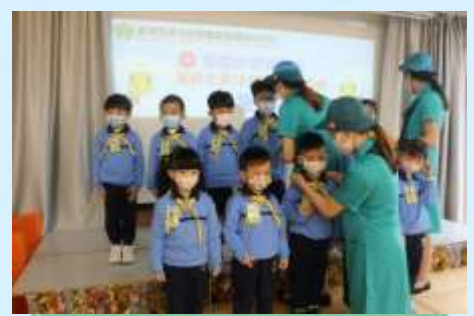
我哋系咪企得好端正呢？