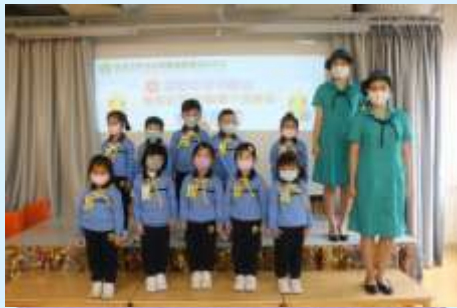
我會用心做好小蜜蜂隊員！