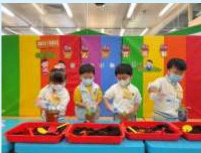
每日都要幫佢淋水㗎！