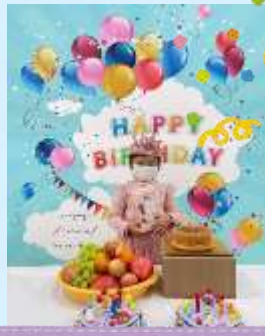
Happy birthday to me!