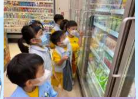
睇吓雪櫃入面！有雪條啊！