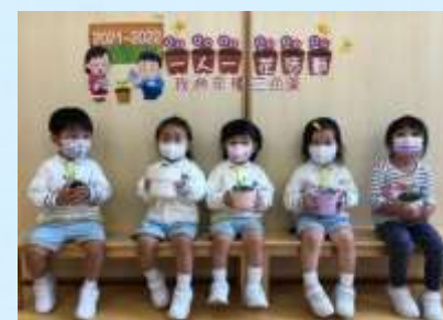
花兒要快高長大啊！