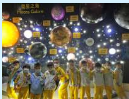
我哋同衛星合照啦！