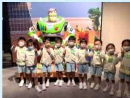
我哋同巴斯光年影相啊！