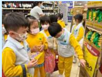
望吓價錢牌睇睇幾錢先！