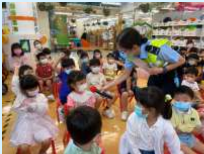
要拖住大人先可以過馬路！