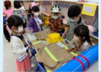
呢套系消防員嘅衣服嚟㗎！