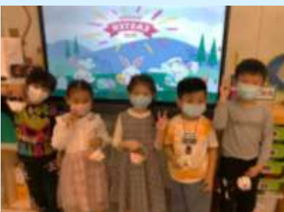
祝大家有個快樂既復活節。