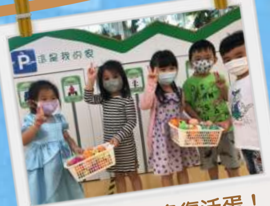
我們找到很多復活蛋！