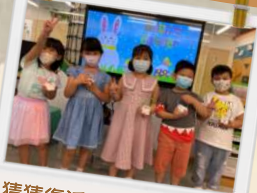
猜猜復活籃子裡有甚麼？