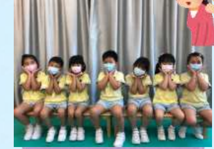
我哋會一直陪住你！