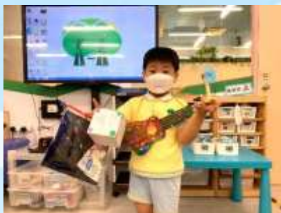
唱首歌畀你哋聽啦!