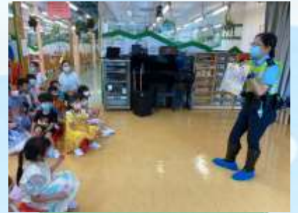
馬路上有好多車㗎！