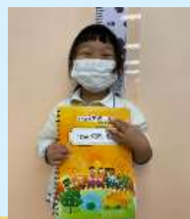
我鍾意同媽媽一齊玩親子盒