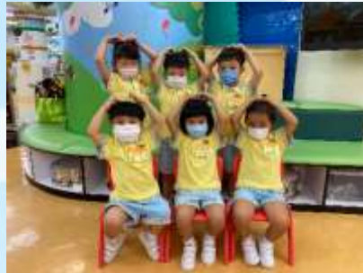
送個大心心畀你哋啦！