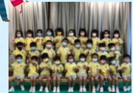
爸爸媽媽，辛苦你哋啦！