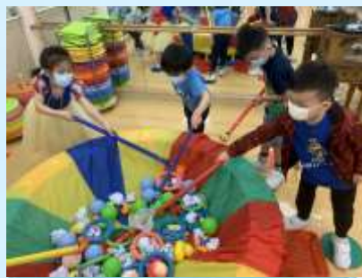
我哋撈緊啲復活蛋啊！