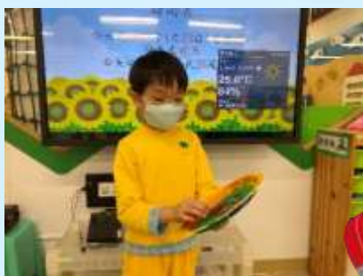
我依個係磁力車嚟!