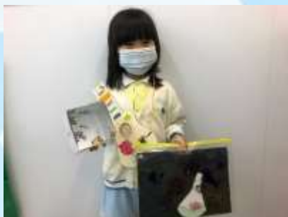
你睇! 盞照明光唔光!