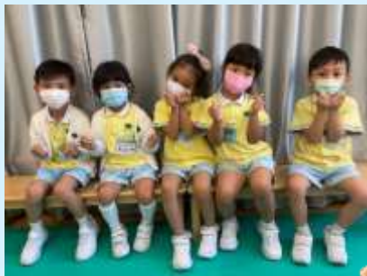
我大個咗會照顧你嘍！