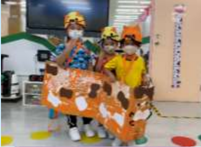
我哋系小花貓啊！喵～