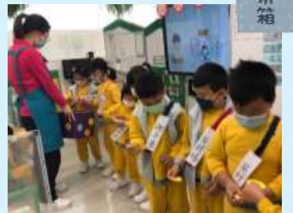
你哋每一票好重要！