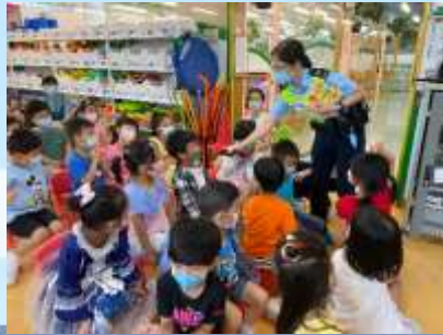
綠燈嗰時會有好快嘅「嘟嘟」聲！