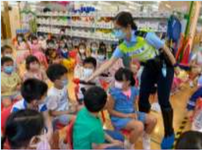
過馬路嗰時要睇人像燈！