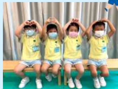
我鍾意同爸爸媽媽一齊玩。