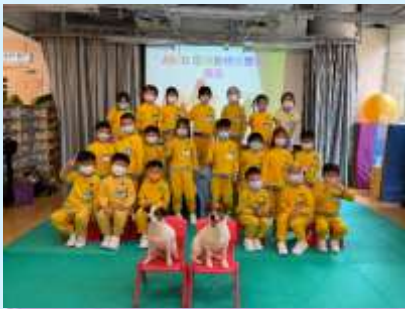
我會做個盡責小主人。