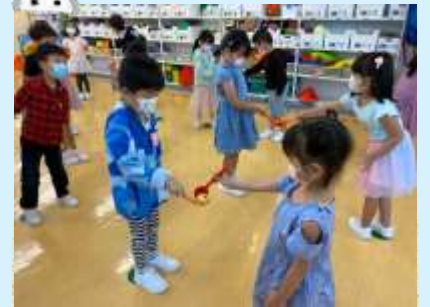
Yeah復活節慶祝會真好玩！