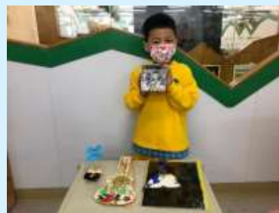
系好有趣嘅小手工呀!