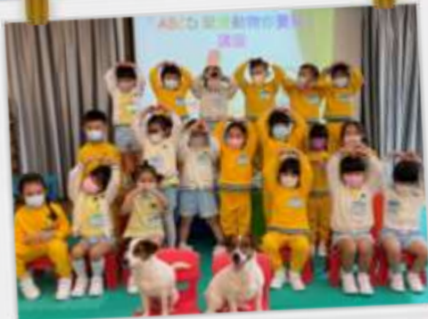
小狗真乖，我們一起拍照～