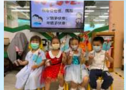
祝爸爸、媽媽天天快樂！