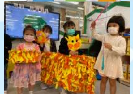
你睇！小貓咪嘅毛靚唔靚啊？