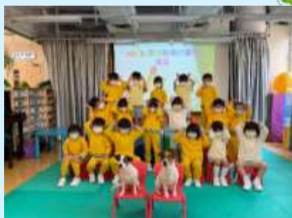
我哋都有小狗耳朵啊！