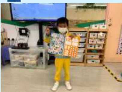
我同爸爸媽媽一齊完成晒啦!