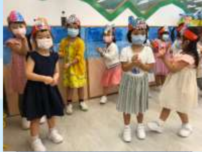
快啲睇睇我哋表演啦！