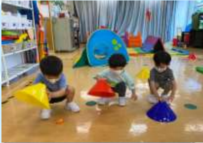
咦？呢度有冇復活蛋呢？