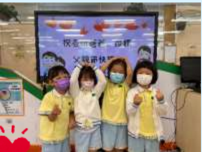
爸爸媽媽I love you！