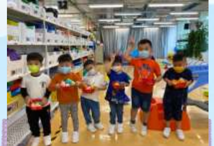
你睇！我哋搵到好多蛋啊！