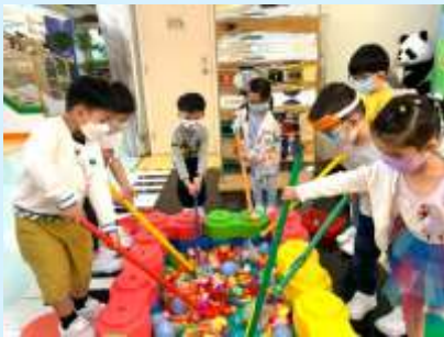
你估下邊個撈到最多復活蛋。