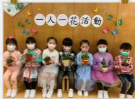
看看我們的小盆栽！