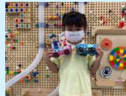
你睇吓我架小火車!