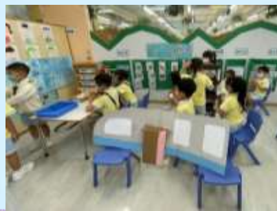
各位乘客，飛機即將降落！