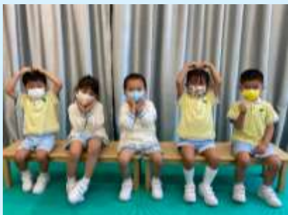
多謝你哋一直照顧我。