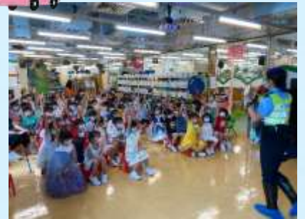
安全過馬路，我做得到！