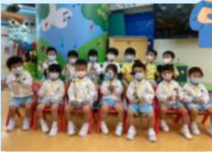
同爸爸媽媽一齊好開心。