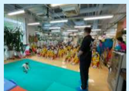
小狗嘅動作好靈敏啊！