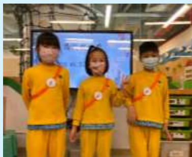
我承諾會服務大家！