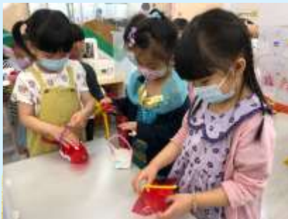
我哋整咗個籃裝住復活蛋！