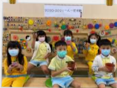
小盆栽要快高長大喔～