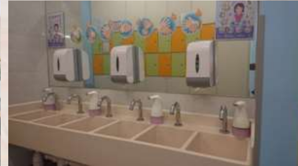
自動感應水龍頭、自動感應洗手液機